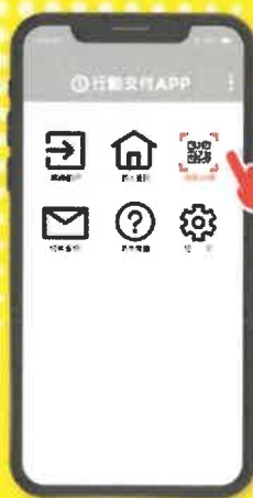
開啟APP 選擇掃描功能